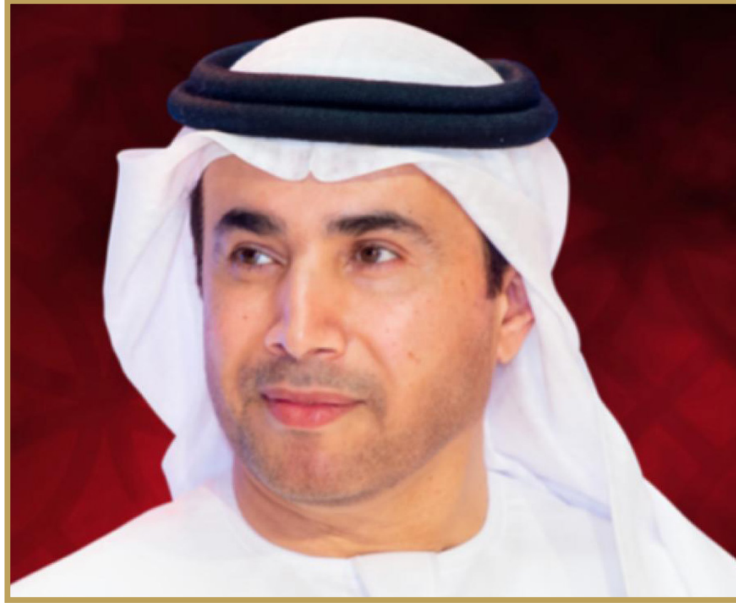
سعادة اللواء الدكتور أحمد ناصر الريسي رئيس مجلس الإدارة