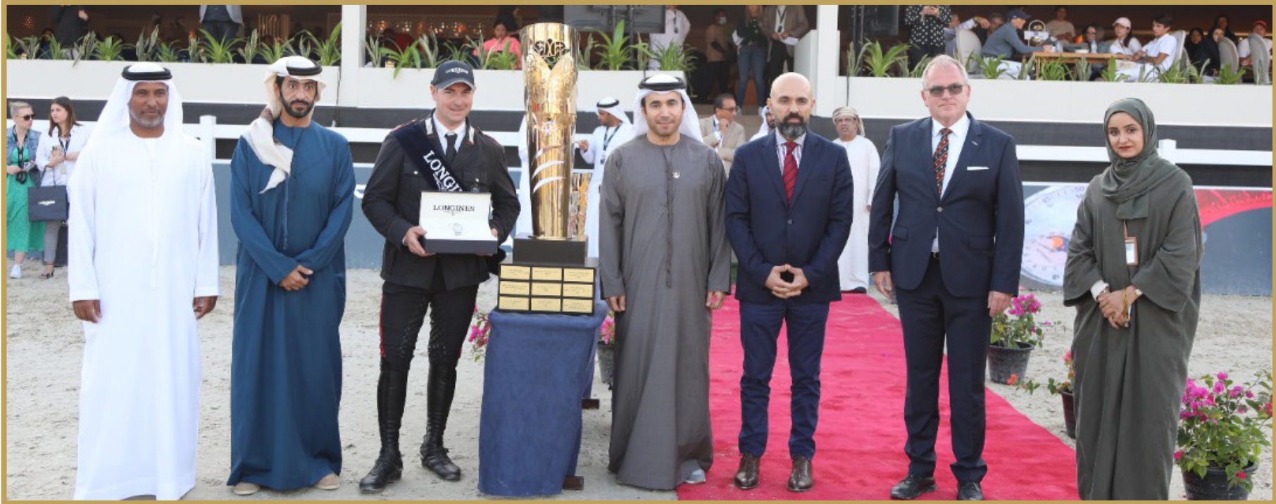
فريق النمسا البطل التاسع لكأس الأمم بعد جولة «التمايز» الفاصلة

إبداع في «الفرسان» وحضور جماهيري كبير يشعل «الميدان»