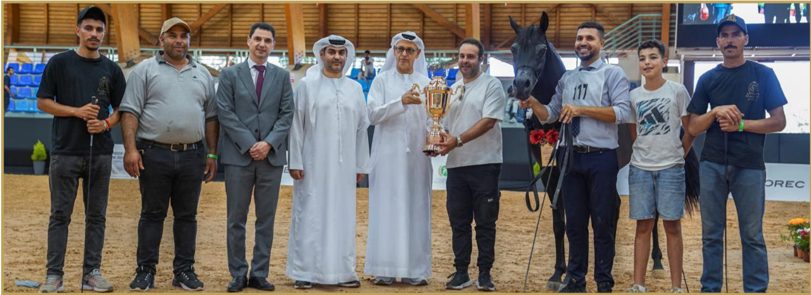
«تيسير قطبية» و«حكمة إم أي» و«سلسبيل بي إم» و«أيه بي بدر» الأبطال