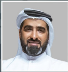
سعادة طارق محمد المهيري