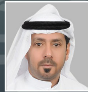
سعادة مسلم سالم العامري