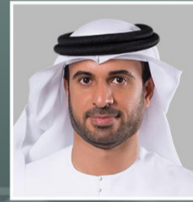
معالي سلطان ضاحي الحميري