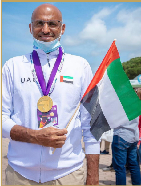
العظب: المونديال معبر لمزيد من الإنجازات