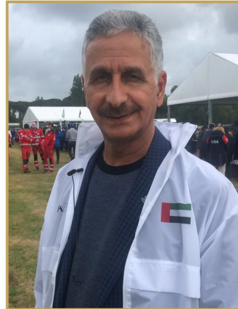
الهاجري: الانتصار نهج راسخ لفرسان الإمارات