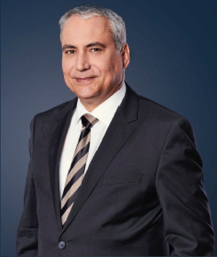
انجمار دي فوس رئيس الاتحاد الدولي للفروسية

وأخيراً وليس آخراً، أود أن أشكر المنظمين وجميع أولئك الذين كرسوا وقتهم والتزامهم ودعمهم للتشغيل الناجح للسلسلة، ما يسمح للناس في جميع أنحاء العالم بالمشاركة مباشرة مع قسم قفز الحواجز في الاتحاد الدولي للفروسية وللرياضيين، والدول المشاركة كافة، أتمنى كل التوفيق.. وبلا شك أتمنى للجماهير أن تستمتع بأفضل ما تقدمه رياضتنا.