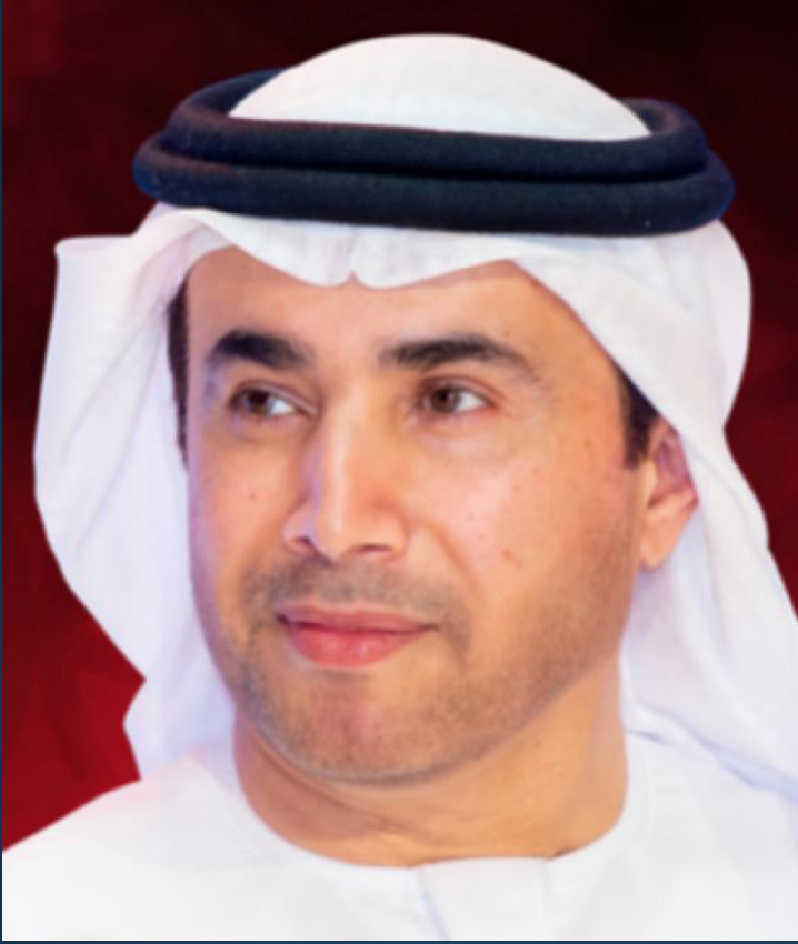
الدكتور أحمد ناصر الريسي رئيس اتحاد الإمارات للفروسية والسباق

توافر بنية تحتية متكاملة، وبأعلى المعايير العالمية، وتعاون الأندية في الدولة، حيث نعمل مع الجميع من أجل أن تكون قفز الحواجز في القمة، وهي تقدم إلى العالم أبطالاً إماراتيين ينافسون بثقة ومهارات عالية. أهلاً بالجميع في أبوظبي التي تحتضن العالم في كل المناسبات بحب وتفرد، عاصمة إمارات الخير والعطاء والأمان، وشكراً على وجودكم وإسهامكم بالتفاعل الإيجابي لإنجاح البطولة.