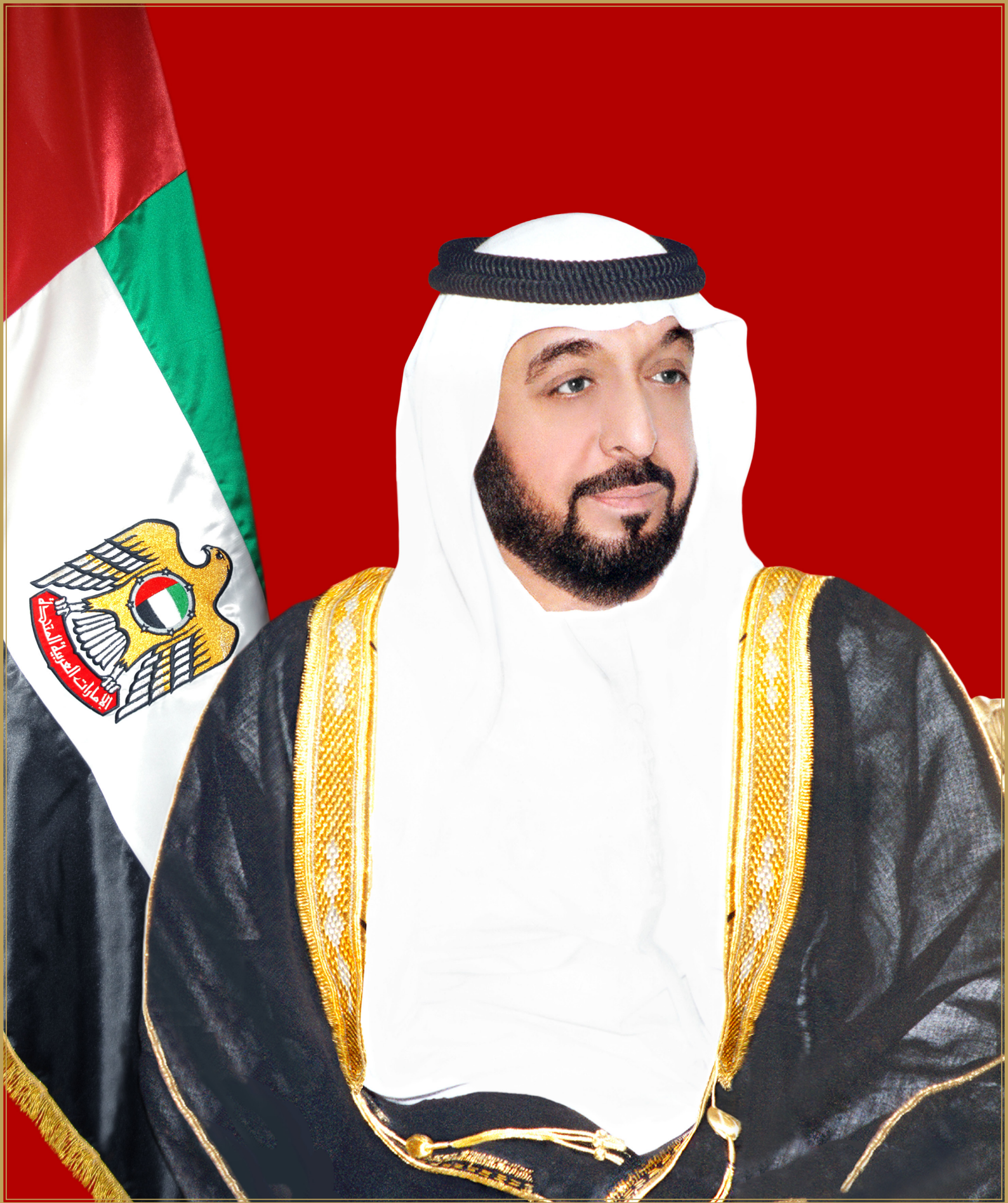
His Highness Sheikh Khalifa bin Zayed bin Sultan Al Nahyan The President of the United Arab Emirates